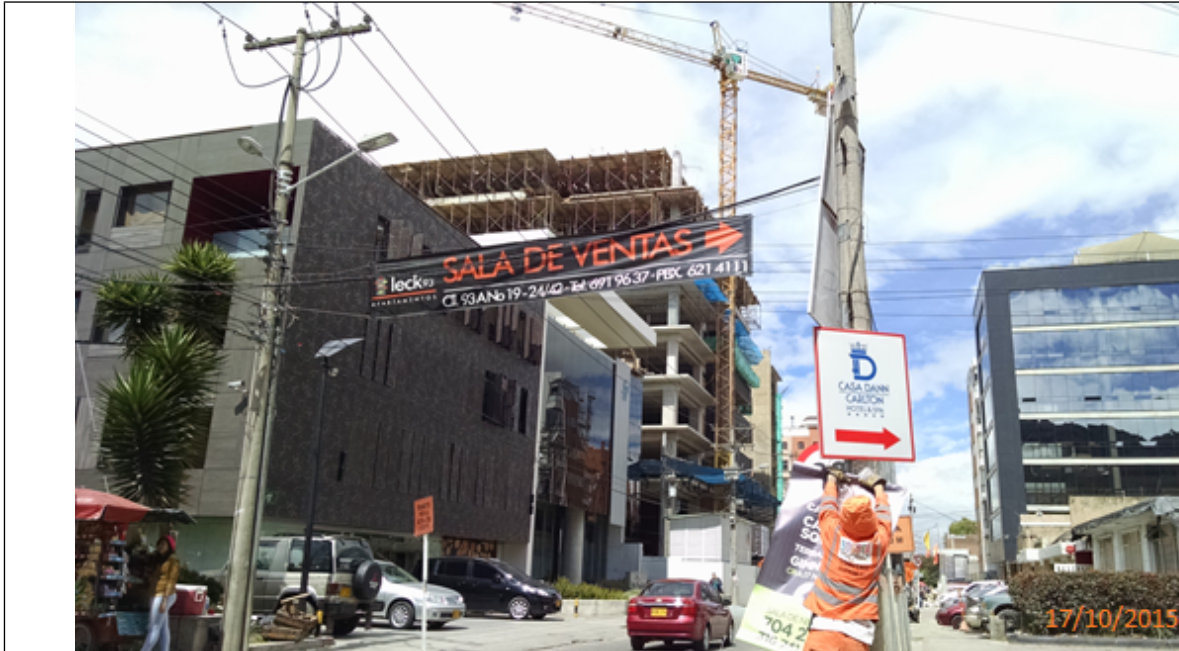
Fotografía No. 2. Elementos instalados en Espacio Público. Operativo en la Localidad de Chapinero, día 17 de Octubre de 2015. Aviso desmontado sobre la Calle 93 con Carrera 19.