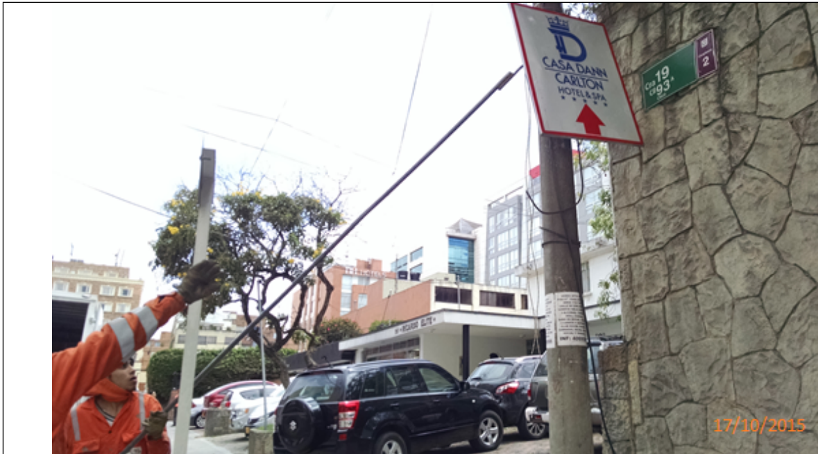
Fotografía No. 4. Elementos instalados en Espacio Público. Operativo en la Localidad de Chapinero, día 17 de Octubre de 2015. Aviso desmontado sobre la Carrera 19 con Calle 93 A.