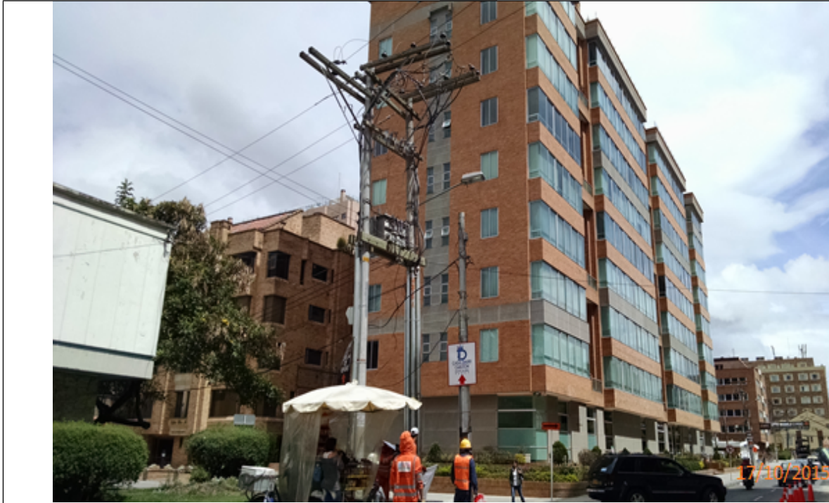
Fotografía No. 3. Elementos instalados en Espacio Público. Operativo en la Localidad de Chapinero, día 17 de Octubre de 2015. Aviso desmontado sobre la Carrera 19 con Calle 93 Bis.