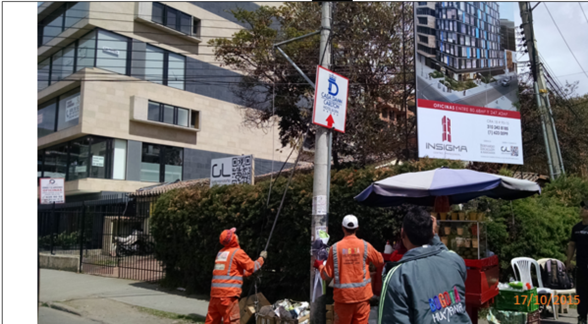
Fotografía No. 1. Elementos instalados en Espacio Público. Operativo en la Localidad de Chapinero, día 17 de Octubre de 2015. Aviso desmontado sobre la Calle 93 con Carrera 18.